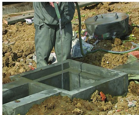
图11 向沼气池中注水

10.2 气压法 池体加水试漏的方法与水压法相似。确定发酵间和进、出料管水位以下不漏气、漏水之后,抽出池中水,将进、出料管口及活动盖盖严,接上U型水柱气压表,向池内充气。当U型水柱气压表数值升至设计工作气压时,停止充气,关好开关,稳压观察24 h。如果U型水柱气压表下降数值小于设计工作气压的3%,则表明该沼气池的抗渗性能符合要求。