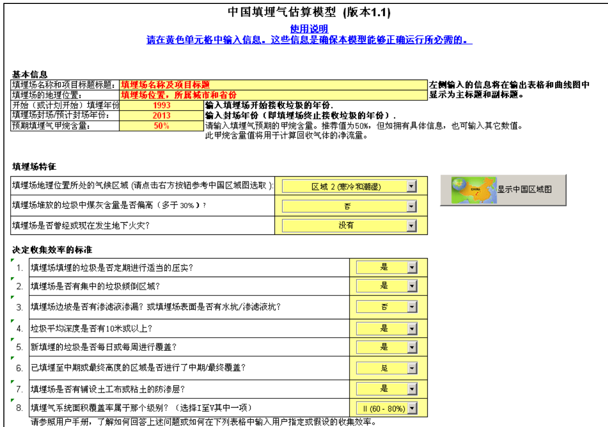
图 1 – 模型输入截图

如用户缺乏数据而不能具体回答步骤9至16的问题，模型将不能提供收集效率的推荐值。在这种情况下，用户可以直接跳到步骤17输入收集效率假设或一般值。一个按中国一般填埋场行业标准来建设和运行的填埋场，封场前的收集效率通常在25%至40%之间，封场后在50%至65%之间。